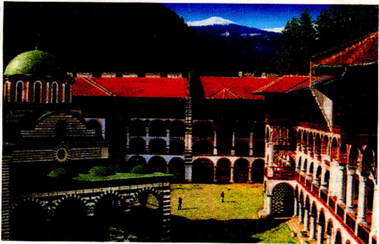
Rila Kloster, Bulgarien